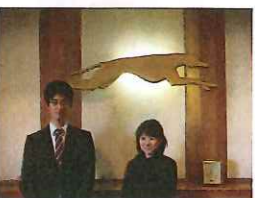
フロントには犬のマーク