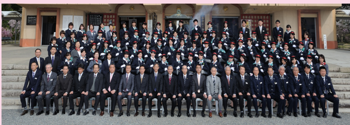
64名の新入社員が入社