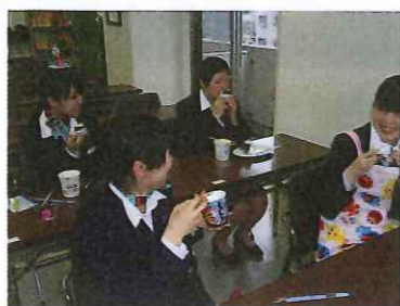
1日の元気の源、朝ごはん! おにぎりの日とサンドウィッチの日があります。

今年も東京支店に8名の新入ガイドがやってきました!! 故郷を離れ、勉強勉強の忙しい毎日を同期と力を合わせて頑張っています。 5月8日のデビューに向けて、今は研修期間中です。そんな初々しい彼女たちの研修期間中の一部を紹介します。