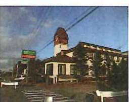
家族旅行も大歓迎

スポーツ設備が充実した帝産ロッヂ には、一年を通して移動教室や道 スケート他合宿団体が訪れますが、 観光目的のお客様にもおすすめの 宿です。