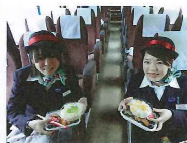
お弁当もって満面の笑み(笑)