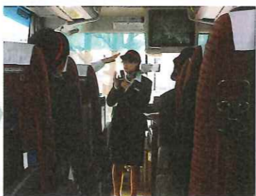
何度か通った道は、マイクを持って ご案内。