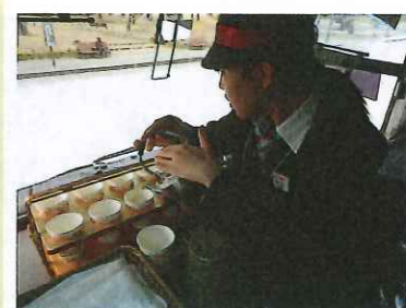
昼食の時に、お茶の入れ方も練習!