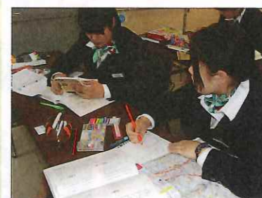
案内の時に使うノートを地図を 見ながら作成中。