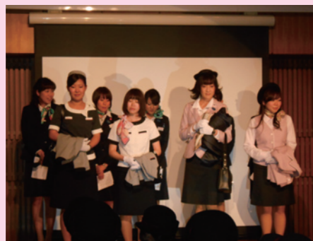
新制服お披露目ファッションショー