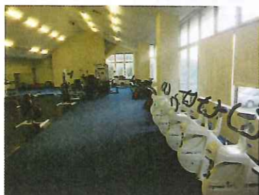
本格的トレーニングマシン完備