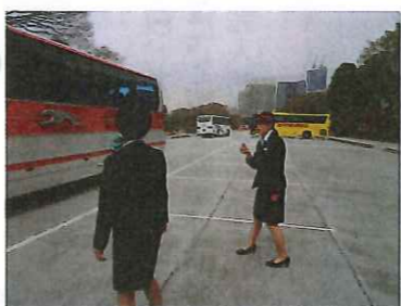
安全運行のためのバック誘導は 緊張します!!