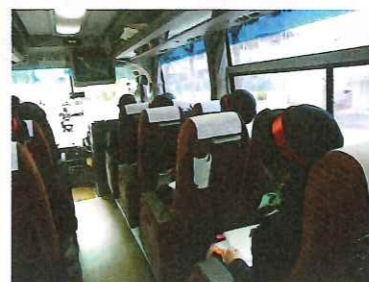
車内では、先生のお話を聞いて、 見て、書いてと大忙し。