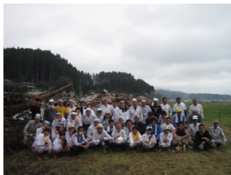
一昨年7月、陸前高田にて