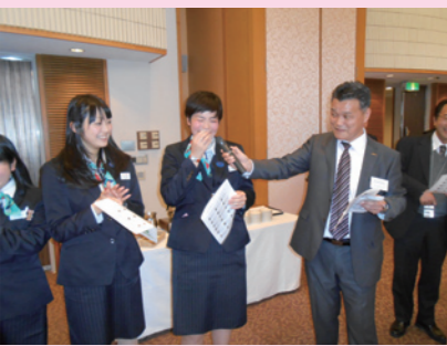
大阪支店新入ガイドへのインタビュー