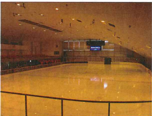
記録が伸びる! スケートリンク

そしてなんと9月にはこのリンクで、 「ソチ」オリンピックの第一次選考会が 開催されます。