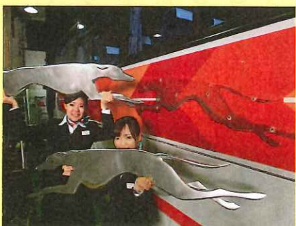
犬のマークが外れた所を初めて見たので 記念に一枚