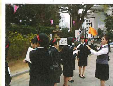
各観光地で誘導の確認。 制服を着てみんなで歩いていると、 周りの人たちに写真を撮られます。