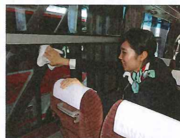
車庫に帰って来たら、車内清掃も ひとつひとつ覚えていきます。