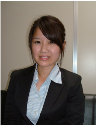
恐縮しながらもインタビューに 答えてくれました

A お客様のお名前とお顔を全員覚えることは、とても 重要なことだと感じました。お客様のお名前とお顔を 覚えるだけで人員確認など、スムーズにいきました。