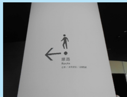
展望台の順路案内の人型が…

東京といえばスカイツリー！！いつもお客様を展望台までご誘導しますが、 隠れ〇〇があるという事で、今回はそれを探しに行ってみました。 皆さんもぜひ探しに行ってみてください♪