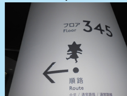
ソラカラちゃんになっています