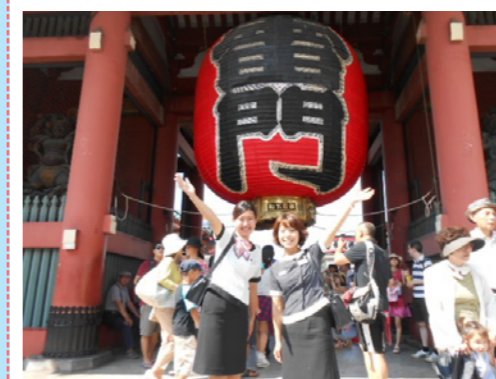
浅草の代名詞・雷門。 とても迫力があるので、来た時には 是非ここで写真を撮！