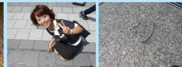
スカイツリーの床には隠れ「ソ・ラ・カ・ラ」 の文字が刻印されています。 実は「ラ」「カ」「ラ」は1枚ずつあり、 これはなかなか見つかりません！