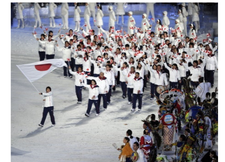
バンクーバーオリンピック開会式の様子

帝産ロッジは、文科省によるショートトラックスピードスケートのナショナルトレーニングセンター(NTC)に指定されています。帝産観光バスは「ソチオリンピック」を応援します。