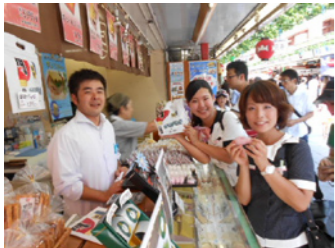
舟和のいもようかん

明治35年から続く老舗です 箱を開けた瞬間のお芋の香りが たまりません 「舟和本店 仲見世2号店」 東京都台東区浅草 1-30-1 TEL 03-3844-2782