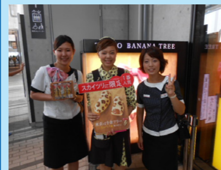
東京のお土産と言えば“東京ばなな” スカイツリーには、「限定ひょう柄 チョコバナナ味」があるよ！ お姉さんの制服もひょう柄です