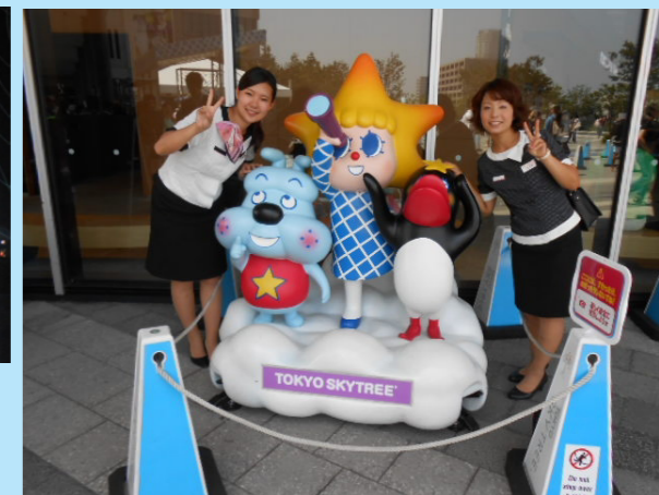
スカイツリーの公式キャラクター “ソラカラちゃん”と一緒にパシャリ

スカイツリーのエレベーターは “春夏秋冬”ありますが、その 中の“夏”のエレベーターでは 到着時「634」の文字が浮かび あがります！(高さも634mです)