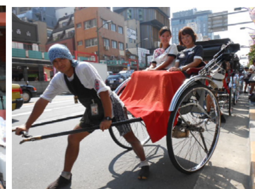
人力車のお兄さんはイケメンが多い という噂が… 本当にイケメンだった～