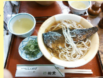
京都にしんそば おいしいですよ。

など地域によって変わりますが、京都では「にしんそば」を食べます。京都にしんそばの元祖、京都の有名店「松葉」。京都四条「南座」の隣にあって、芝居を見に来た人が食べて行く、ということが広まったそうです。