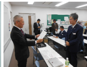
表彰状授与式の様子