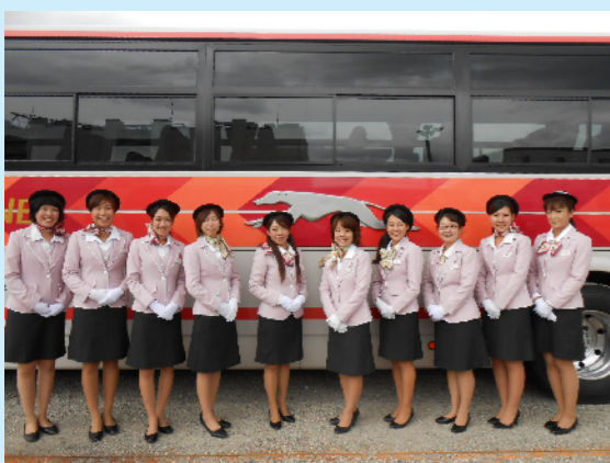
来年も良い年になりますように

師走に入り今年も残り一ヶ月となりました。帝産観光バスをご利用頂いたお客様ならびにエージェンツの皆様、今年一年間大変お世話になりました。 今年は、ガイドの制服リニューアルや陸前高田ボランティア実施、ガイド広報活動、新高速乗合バススタート、安全性ニツ星取得など新しい事にチャレンジし、充実した一年でした。 来年も更に安全・安心で皆様から愛されるバス会社になるようにパワーアップして行きます。 来年も帝産観光バスにご期待下さい。