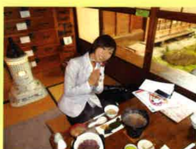
あっさりしていてさらっと食べられます。いただきます～