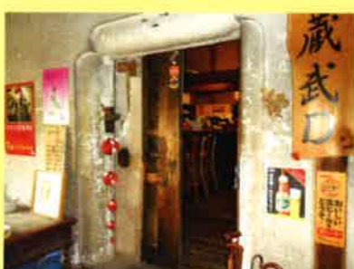
お店の奥には倉庫を利用した夜限定の Bar もあります