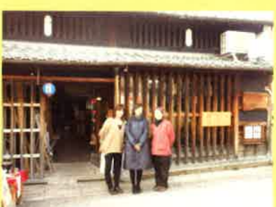
皆さんも是非! 暖暖(のんのん)の皆さんありがとうございました