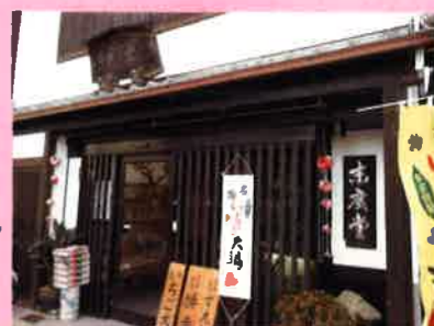
和菓子の有名な末廣堂さん