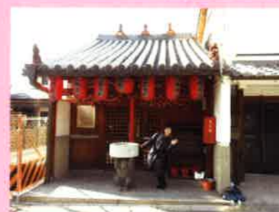
ならまちといえばこれ！身代わり猿の庚申堂です