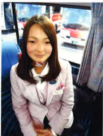
母が添乗員、私がガイドとして一緒に仕事をすることが楽しみです

●歴史関係のテレビをついつい見ってしまう ⇒面白ネタはネタ帳にメモ(次に使うゾ)