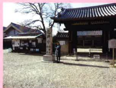
元興寺です。ならまちは元々、全て元興寺の境内でした

今回は、奈良公園・興福寺の少し南、今も古い街並みが残る『ならまち』を訪れました。最近では、「にやらまち」とも言われ、のら猫の姿もよく見られる場所です。