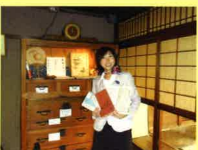
店内には明治・大正時代の教科書もありました

茶粥は、ほうじ茶で作るのが基本。東大寺二月堂の修行僧がさっと食べられる物として作られました