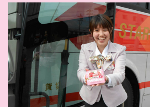
いつもありがとうございます

2月14日、やって参りましたバレンタインデー。今年も2月14日ご乗車のお客様にバスガイドから感謝の気持ちと愛を込めてチョコレートプレゼントするガイドプロジェクト企画「バレンタイン大作戦」を行います。この企画は、バスガイドからお客様へ直接感謝の気持ちを表現できないかという想いの発案から始まり、今年3年目を迎え、毎年好評をいただいております。ガイド一同、チョコで素敵な1日になるよう気持ちを込めてお贈りします。