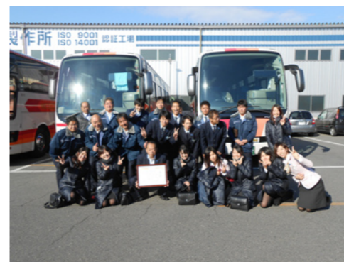
喜びを分かち合う奈良支店社員

帝産ロッジは、文科省によるショートトラックスピードスケートのナショナルトレーニングセンター(NTC)に指定されています。帝産観光バスは「ソチオリンピック」を応援します。