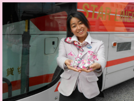
チョコ受け取って下さい