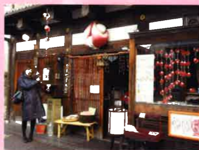
ならまち資料館には、こんなに大きな厄ざるが！