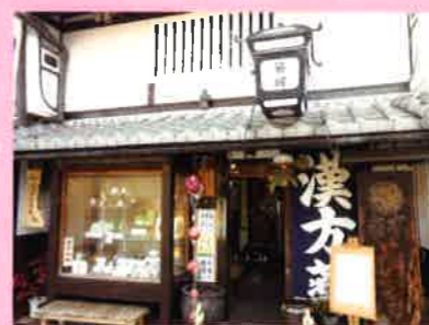
こちらは創業 800 年の歴史を持つ漢方薬のお店