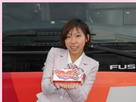
ご乗車お待ちしております