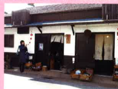
屋根からぶら下がっている赤い物は厄ざるといふ縁起物で家族の人数分吊り下げるそうです