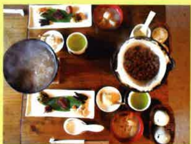
古代米のおこわ膳(右)と茶粥(左)茶粥は奈良県の家産料理で今でもよく作られる方もいます