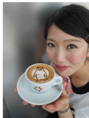
これが、ハルカスのキャラクター「あべのペア」のアートラテ。可愛くて飲むのがもったいない。

勿論、女の子が大好きなケーキも5種類程あります。丁度いい甘さが後引く美味しさです。