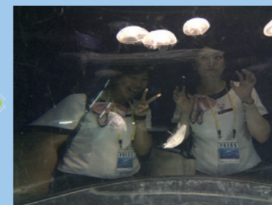
ふあふあクラゲ館。やっぱりクラゲはいいですね。癒されます!!