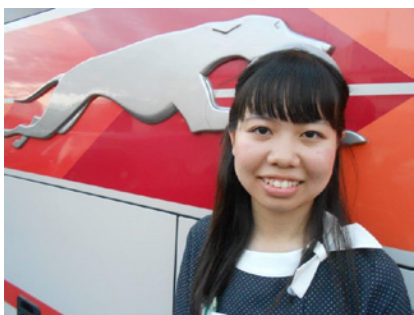
大切な同期もたくさんできました

目利き鼻効きバスガイドがコソコソ教えるオススメ現地グルメ ガイドさんの目撃食べ!