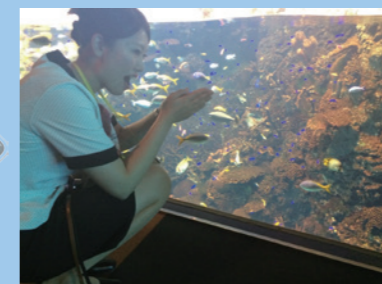
グレート・バリアリーフ