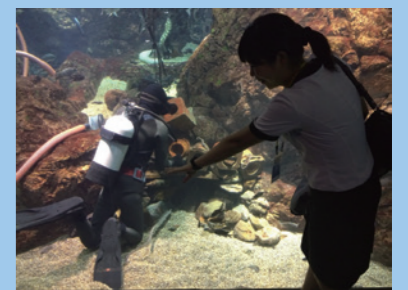
ダイバーとパチリ