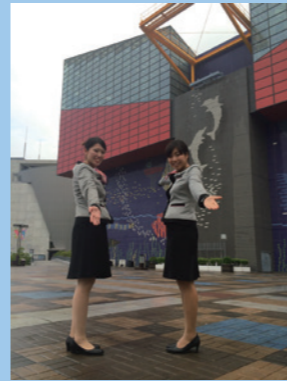
おなじみの正面から!! 高速の上からも見えます☆