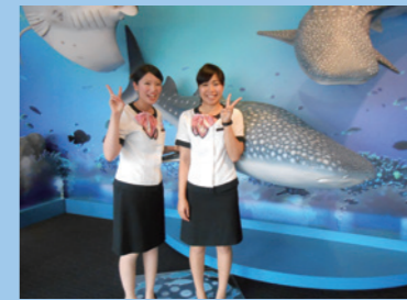
入口で記念撮影できます