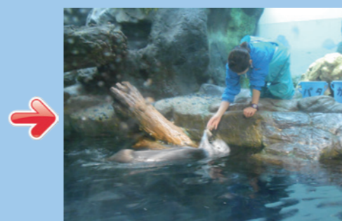
アリューシャン列島