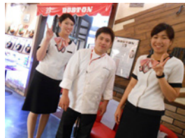
何度か TV 出演されています

創業 60 年、ハンバーグにこだわったお店、昭和町「BOSTON」さんが、あべのハルカスにも登場。レトロ感そして、おしゃれな店内はレコードがたくさん飾られています。