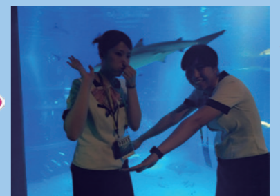
太平洋。この水槽を中心に上の階から下へ下へと降りていきます

ここが一番の見所です! 今回は、残念ながらシンベエザメの「遊ちゃん」は、いませんでした。また会いに来て下さい。