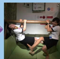
熱帯雨林を体験! そして、なりきりました