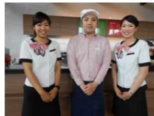
店長さんと一緒に。

目利き鼻効きバスガイドがコソコソ教えるオススメ現地グルメ ガイドさんの目撃食べ!