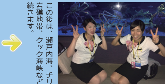
この後は、瀬戸内海、チリの岩礁地帯、クック海峡などが続きます。

ここが一番の見所です! 今回は、残念ながらシンベエザメの「遊ちゃん」は、いませんでした。また会いに来て下さい。