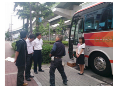
二人の協力で旅を演出

バスのハンドルを握るのは運転士さんですが、私たちバスガイドも安全運行を補佐しています。左折時に運転席から見えにくい死角を確認したり、バック時にバスを降りて目で誘導したり、運転士さんの「第2の目」となって、お客様に「安全」というサービスを提供しています。 逆に運転士さんも案内ポイントが近づくガイド(特に新人ガイド)に、それとなく合図を送ってくれたりします。 お互いをフォローし合う二人のチームワークで、私たちは楽しく安全な旅を演出していきます。