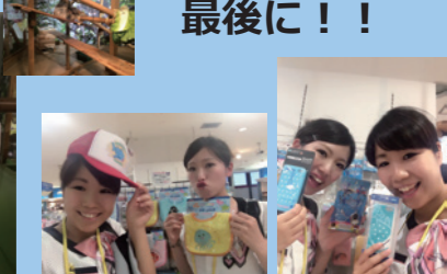
こんなお土産があります