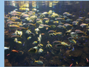
入ると、こんなにキレイ! いいよスタート!!