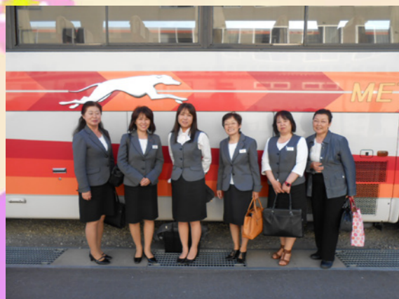
各支店の先生方 / 教育は私達にお任せください

バスガイドを目指すなら帝産へ! 夏休みを間近に控える7月、2015年度新入ガイド募集がいよいよスタートします。来春も今年に続き50名以上の採用を予定。日本全国に向けて求人活動を展開します。バスガイドの育成に定評のある帝産観光バス。頼りになる先生方が各支店に常動しています。 優しい先生方の厳しい指導で、今年入社した新入ガイドの皆さんは、5月にガイドデビューを果たし、現在バスガイドとして最前線で活躍しています。 バスガイドを目指すなら帝産へ! みなさんのご応募をお待ちしています。 帝産レディの活躍は、ホームページやフェイスブックでご覧になれます。