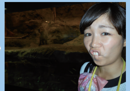
エクアドル熱帯雨林