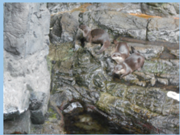
日本の森ゾーンから始まります