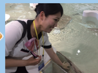
サメやエイに触れるコーナーがあります