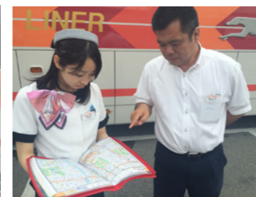
お互いにルートを確認