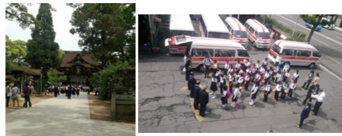
タクシーを降りてご案内

帝産バスが修学旅行で賑わっている同時期、帝産タクシーも頑張っています。観光タクシーでの修学旅行の班別行動。観光地では、ドライバーと一緒に歩いて、タクシー運転士しか知らない京都の魅力をご案内します。タクシーでの班別行動で困るのは出発前の集合場所や乗車場所。安全第一を考え、帝産バスで乗り継いで、当社車庫よりご乗車頂くこともあります。