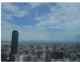
晴れる時は、京都タワーも見えます

あべのハルカス内にある「チャオブレッツ」さんに行ってきました。奈良・京都・三重にも、お店があります。17階からの景色を見ながらのティータイム♪