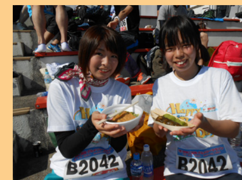
茶そば&お団子 グルメも楽しみつつ…