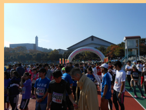
すごい数の人！人！人！