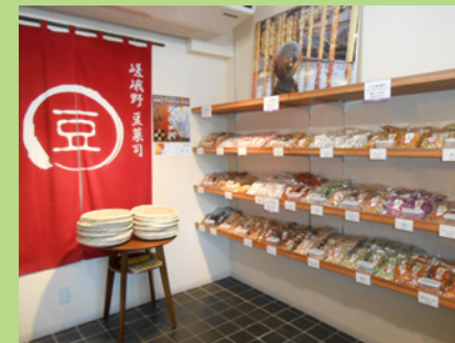
店内には豆菓子がいっぱい