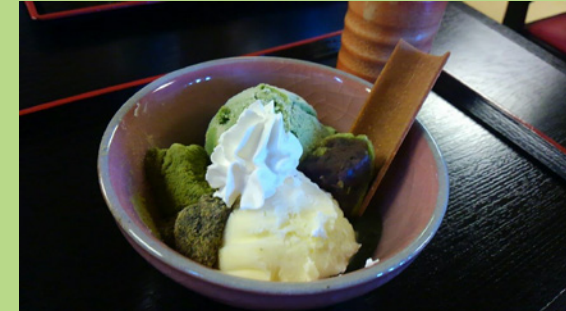
店長さんオススメ「渡月パフェ」