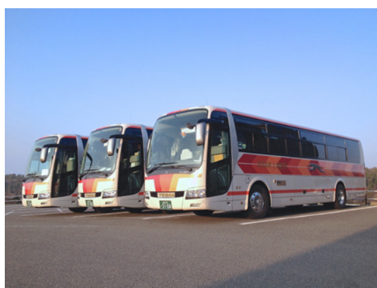
来年もよろしくお願いいたします

今年もご愛顧 有難うございました 師走に入り今年も残すところ僅か1ヶ月となりました。帝産観光バスをご利用頂いたお客様ならびにエージェンツの皆様、今年も一年間大変お世話になりました。 今年も、新運賃料金制度移行や帝産タクシーとのコラボレーション、フェイスブックいいね！プレゼントキャンペーン、ガイド国内研修旅行、ガイド広報活動など多分野にチャレンジし、実りある一年でした。 そしてこの12月には、ガイド海外研修でグアム旅行を実施する予定です。 来年も「安全は最大のサービス」をモットーに、お客様から選ばれるバス会社を目指して頑張ります。 来年も帝産観光バスをよろしくお願いいたします。