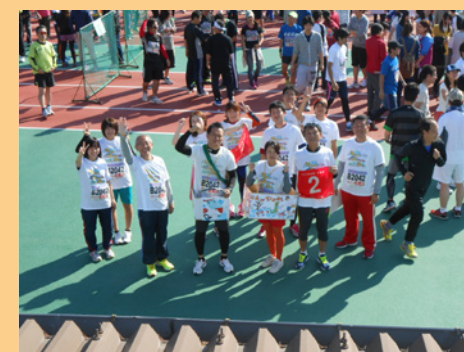
帝産チームお手製バスで一同「がんばります！！」