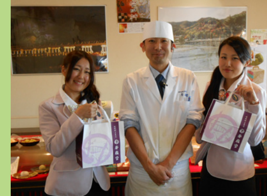
優しい店長さん & 店員さんありがとうございました！

「峯嵐堂」渡月橋本店 京都市西京区嵐山中尾下町 57-2 TEL (075)864-7573(年中無休)