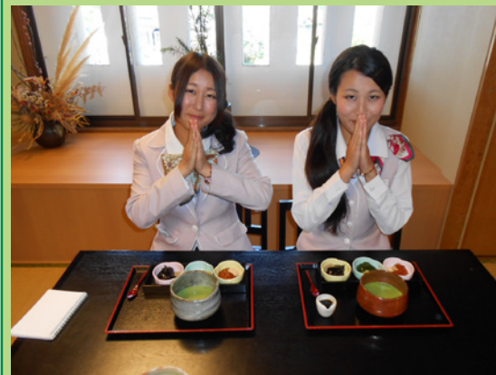
「作り立てとろけるわらびもち」いただきます〜す♡