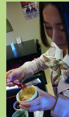
めっちゃ伸びる！もちもち食感♡