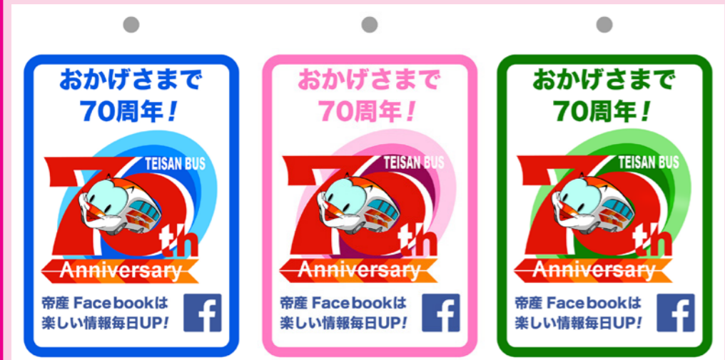
70周年ロゴ入り荷札