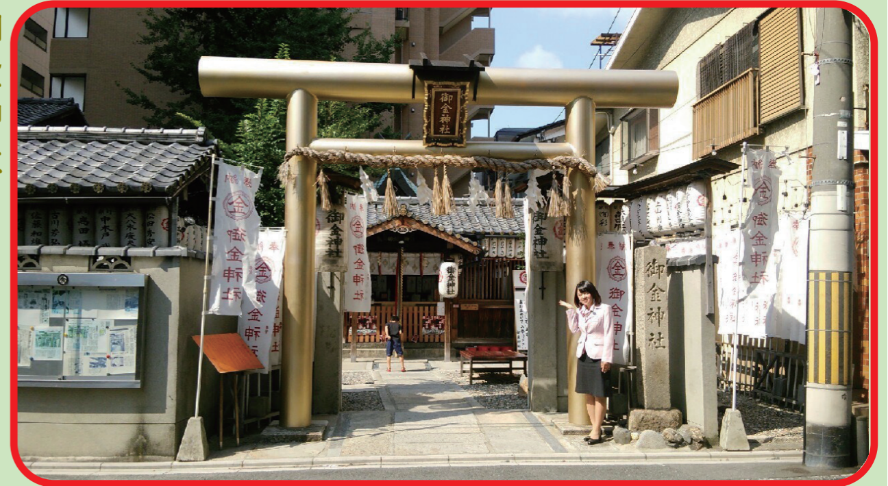
住所：京都市中京区西洞院押小路下ル押西洞院町

御金神社 金・銀・銅その他の合金属に関する神社で、 鳥居も金色！最近では、お金に関する神社で、 来る人が多いです♪