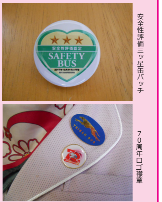
安全性評価三ツ星伍バツチ