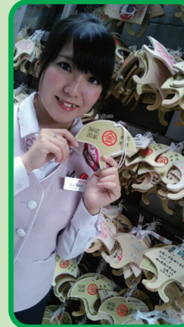
絵馬は、ご神木「いちよう」 の葉の形！珍しいですね☆