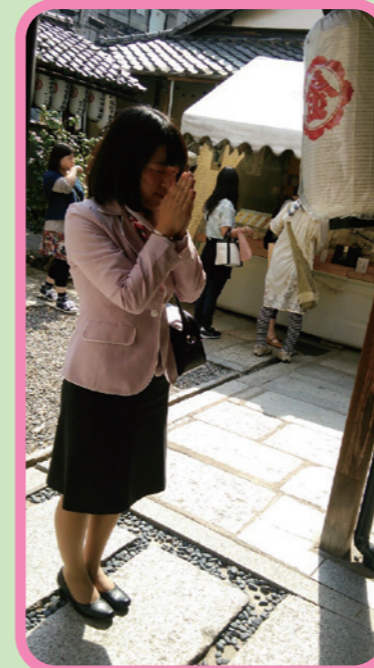
かなやまひこのみこと ご祭神は、金山毘古神、 天照大神、月読神!!!