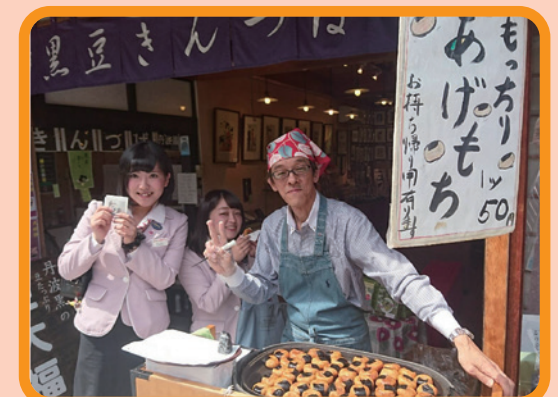
あげもち、美味しい(^^)なんと! 1つ50円!

お仕事の中で出逢った、大切な言葉と風景…。日々の感動が私たちのパワーになるんです!