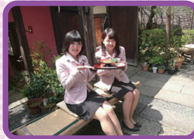
それでは、さっそく頂きま〜す♡

京甘味文の助茶屋さんに行ってきました！ おいしいもの大好き心のバスガイドがお届けする、とっておきのグルメ放浪記。今回はこんなお店に行ってみました♪