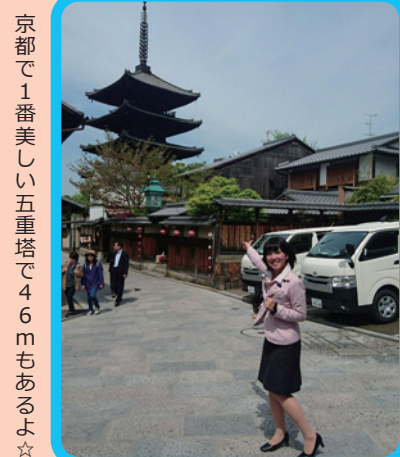
京都で1番美しい五重塔で46mもあるよ☆

2016年は申年!! サルにまつわる所へ行ってみました! 可愛いサルが沢山いたよ♡