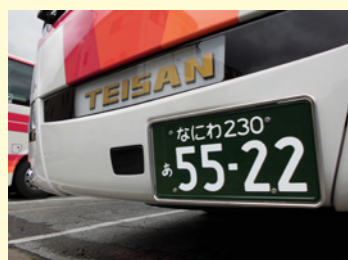
前方車両との車間距離を測定するミリ波レーダーを装着