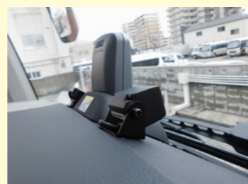
カメラ5チャンネル大容量のドライブレコーダーを搭載