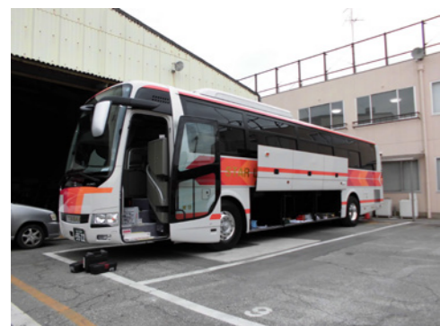
3枚トランクで荷物もたくさん積めます

春のシーズンに向け、新車スターライナー20台を導入します。まずは2月、大阪支店に11台を導入。そして3月には京都支店に1台、神戸支店に5台、大阪支店に3台（内サロタイプ2台）と合計20台の新車を導入します。 今回の導入車両も国交省が推進している「先進安全自動車（ASV）」（先進技術によるドライバーの安全運転を支援するシステムを搭載した車両）となるAMB（衝突被害軽減ブレーキ）を標準装備。また、今年12月1日からの新車に義務化されるドライブレコーダーを搭載。当社では、新車導入を安全対策のひとつと考え、お客様へより安全で安心な車両をご提供致します。 その他、新車スターライナーは、天井直冷式の3枚トランクとなり、大量の荷物の積み込みも可能になりました。また、座席も12列シート54人乗りタイプで、教育旅行やインバウンドなどの大量輸送にも対応します。 4月には、スーパーハイデッカーのニューメーティアを10台導入予定。バスのご利用は安全・快適な帝産バスへ!