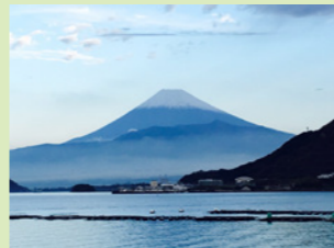
海沿いから眺める雪化粧富士は絶景です!

バスガイドが仕事で訪れたあまたのコースの中から、No.1のおすすめコースをご案内します!