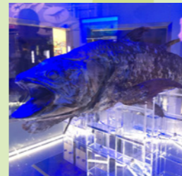
沼津港深海水族館! 世界で唯一シーラカンスの冷凍標本が見られる