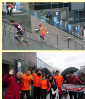
お揃いの帝産カラーで駆け上がりました

2月11日KBS京都主催の「第20回」R京都駅ビル・大階段駆け上がり大会」に帝産京都チームが出演。3回目の出場となった今年は、昨年よりタイムも上がり結果は100チーム中22位! 来年も優勝を狙います。