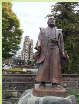
葦山の反射炉 2015年ユネスコ世界文化遺産として正式登録!!