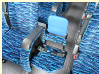
補助席にシートベルトを設置