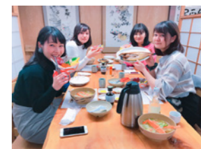
北海道のグルメを堪能