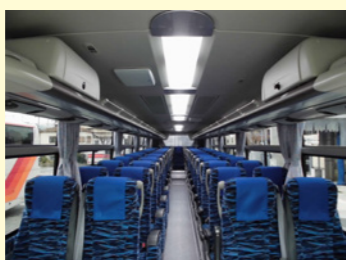
12列正シート49席の54人乗り