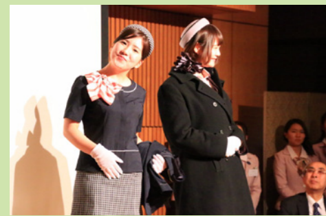
G.P.Jメンバーによる新制服ファッション・ショー