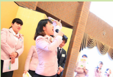
プロフィールをもとに本人にインタビュー