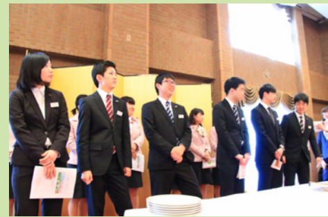
新入事務職員がジェスチャー回答者に