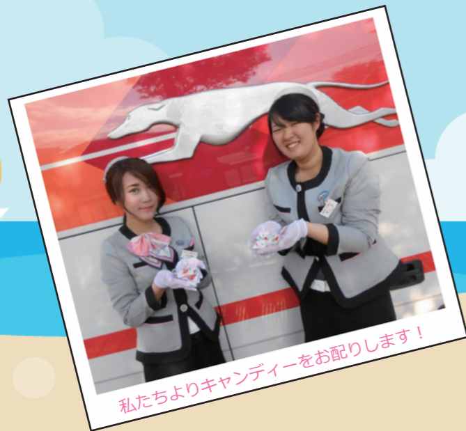
私たちよりキャンディーをお配りします!