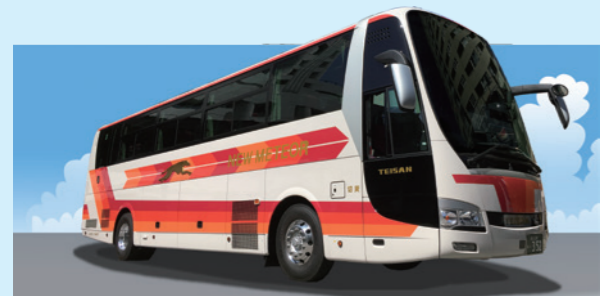
ニューメーティアでお出掛けください

キャンディー・キャンペーン 6月、清々しい初夏を迎え、バス旅行には最高の季節となりました。毎年恒例のサマーキャンペーン。今年の企画は「キャンディー・キャンペーン」です。8月1日〜9月30日の期間に、ガイド付きでバスをご利用頂きましたお客様へ、ガイドより愛を込めてキャンディーをプレゼント致します。 この機会に是非、ご利用ください。 バスガイドなら帝産バスへ 今年入社した1年生ガイドが、5月に無事デビューを果たしました。現在約170名の自社ガイドが在籍し、今後もバスガイド育成に力を入れていきます。 私達は、観光バスと言えばバスガイド、バスガイドと言えば帝産バスと思って頂けるようなバス会社を目指します。