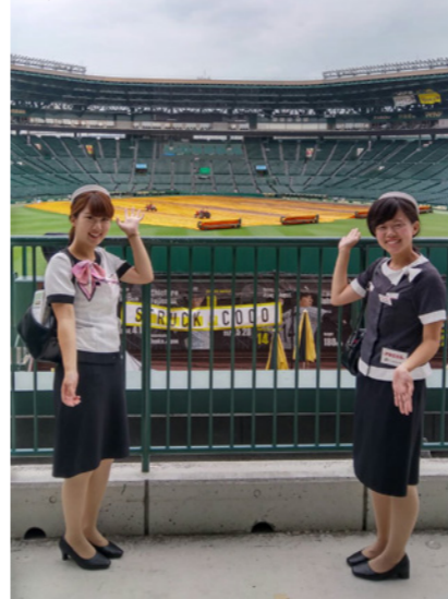
5 バックスクリーンに立ちました! 真上には、電光掲示板があり、なかなかの迫力でした~!

普段の野球観戦では見ることの出来ない甲子園球場の裏側を見学するツアーに参加しました