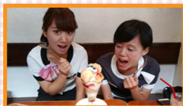
夏はやっぱり桃パフェ 1800円