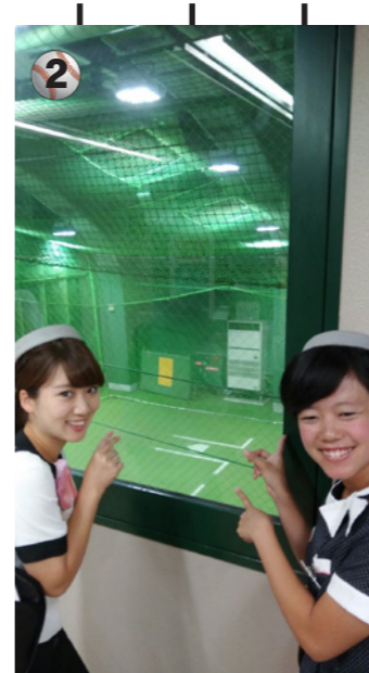
2 TVでも見かけるブルベン! 電話が掛かってくると、リリーフカーに乗ってピッチャー交代です。