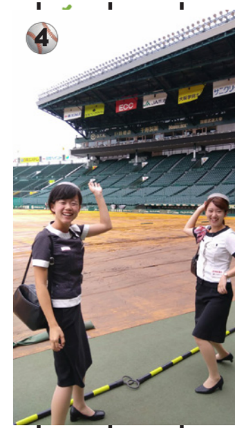
4 初めて甲子園のグラウンドに立ちました。客席から見るのと全く違った感じ!