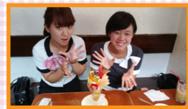
いろいろパフェ スイカが夏らしいですね♪ 1200円

ガイドさんの “ロミグルメ”放浪記! おいしいもの大好き♡のバスガイドがお届けする、とっておきのグルメ放浪記。今回はこんなお店に行ってみました♪