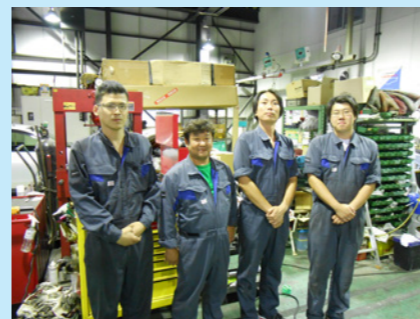
左から秋元整備士、積田整備士、本人、裕丸整備士の4人で東京支店の安全を守ります