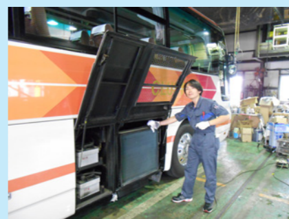
趣味はバイクいじり、ヤマハのドラックスターを愛用