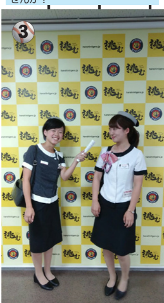
3 ヒーローインタビューをしている場所です。TVで見たことありませんか?