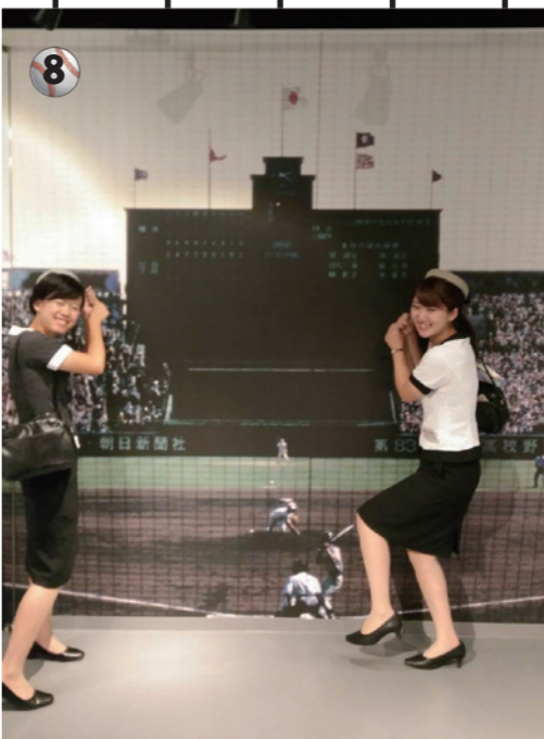
8 歴史館の中で、私達も選手気分になってみました。