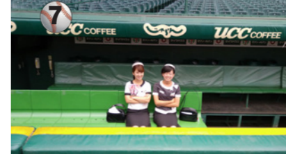
7 選手達が使っているベンチ。気分は監督!?