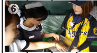
6 甲子園の土を特別に触らせて頂きました。

プロフィール ◎ 2015年入社3年生 ◎ 出身地: 兵庫県姫路市 ◎ 得意なコース: 淡路島 ◎ 趣味: しゃべる事。支店で1番! 誰にも負けません ◎ バスガイドになったきっかけは? 色々な世代の人と話ができるのが、いいなあと思いました