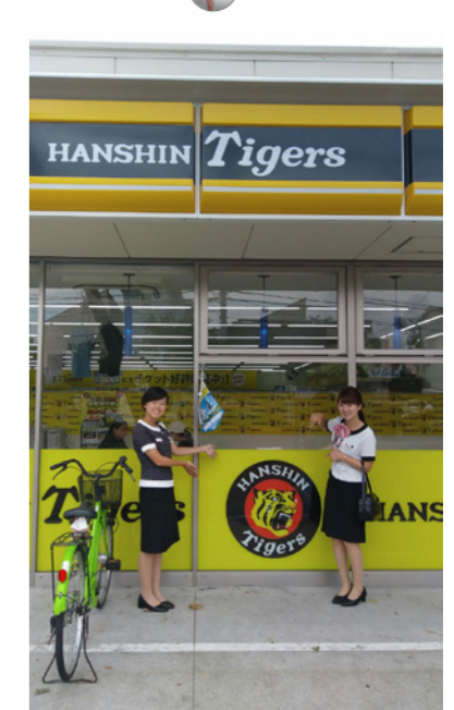
9 阪神タイガースカラーのローソンを見つけました! 店内には、応援グッズがずらり!!

お仕事の中で出逢った、大切な言葉と風景…。日々の感動が私たちのパワーになるんです!