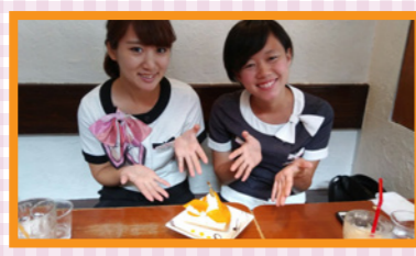
この夏、人気NO.1 宮崎マンゴーケーキ♥ 1000円です！

▼店舗情報 ARROW TREE 兵庫県西宮市池田町 4-25 TEL: 0798-23-0300 平日・土曜日: 11:00 ~ 22:00 日曜日・祝日: 11:00 ~ 21:00 大阪・京都にも店舗あり