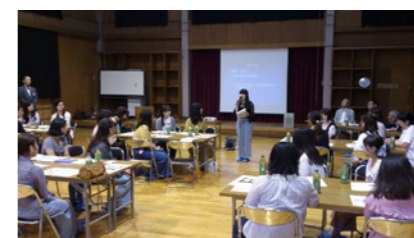
グループディスカッション