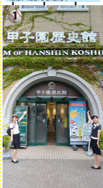
1 甲子園歴史館の入口。高校野球、阪神タイガースファンには、たまりません♥

観光地から穴場スポットまで、日本各地のオススメスポットを“旅のプロ”のバスガイドが現地レポ。あなたもきっと行ってみたいくなるはず!