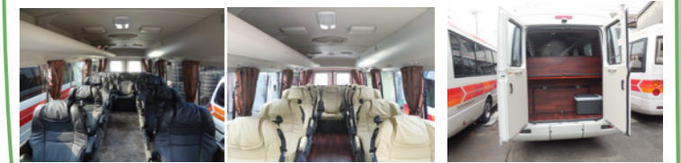
☆中型バス：シートはブラックとベージュ、トランクもゆったり