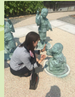
二十四の瞳の子供達と

コース 福田港→安田しょうゆ蔵→ 二十四の瞳の映画村→オリーブ園 →エンジェルロード→寒霞渓→福田港