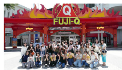
富士急ハイランド

4年目を迎えた当社のガイド研修旅行。7月に2年生の「野辺山・富士急ハイランド」1泊研修を実施しました。 研修の中で、「私の理想の先輩像」というテーマのグループミーティングを行いました。自分の目指すガイド像を話し合いました。今まで先輩に教わってきた事を、今度は自分たちがお手本になって後輩に伝えていこうという姿勢に、全員が着実に成長していることを感じさせてくれました。 来年は、TDR・USJ研修です。また同じメンバーで参加しましょう。