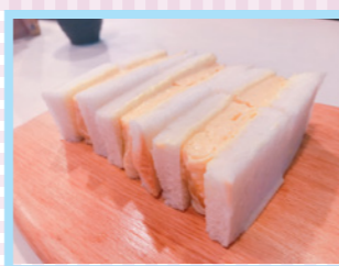
貴婦人の卵サンド!?ピリッときいたマスタードが決めて!相性抜群です!

今回は、行列の絶えない卵料理をメインとしたお店、川越は『小江戸オハナ』さんに行ってきた。