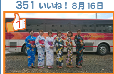
351 いいね! 8月16日 8月16日、今日は京都大文字の送り火です。毎年恒例の送り火鑑賞ツアー。当日乗車も可能ですので、京都にいらっしゃる皆さん!17時半に京都市役所前集合ですよ!お待ちしております\(^o^)/ 京都支店ガイド広報担当

帝産観光バスの Facebook をご存じですか?バスガイド投稿から“いいね”の数が多かったトップ3をご紹介します!