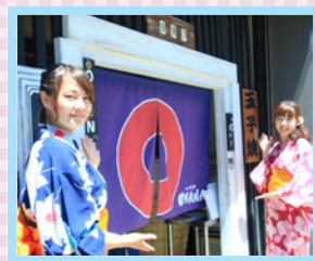
川越に来たらこっ!! 目印はこのマーク!

▼店舗情報 小江戸オハナ 埼玉県川越市仲町2-2 TEL: 049-225-1826