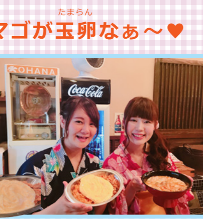
フリッフリの地鶏を使った極上親子丼と昔懐かしい昭和のオムライス。どちらも絶品です!