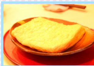
こんな卵焼き初めて!おダシがきいてふあふあです。わさびを付けて召し上がり!