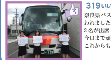
319 いいね! 8月12日 奈良県バス協会による優良従業員への表彰式が行われました。帝産バスからは4年生(3年勤続褒賞)3名が出席!表彰してもらえてとても嬉しいです!今日まで頑張ってきて本当に良かった(*^^*)これからも頑張ります! 奈良支店ガイド広報担当