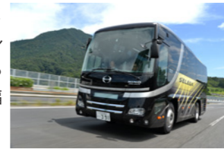
高速道路を走行する9m車。ダウンサイジングエンジンとなったが、プロシフトとの絶妙なマッチングで快走する。

そして試乗車のショート9m車には、新たに新型A05Cエンジンを搭載。従来の直6・7684ccから直4・5123ccへ大胆なまでの大幅ダウンサイジングが施されたわけだ。ミッションにはプロシフトと呼ばれるワイドレシオの7速AMTをマッチ。2ペダルでイージー