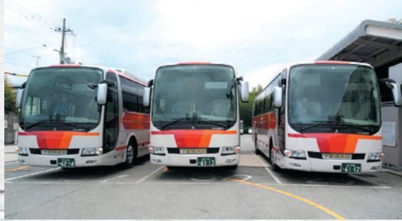
三菱ふそう新型AMT車両を16台導入

師走に入り今年も残すところ僅か1カ月となりました。帝産観光バスをご利用頂いたお客様、ならびにエージェントの皆様、今年も大変お世話になりました。 今年は、昨年国交省で制度改正された運行管理体制・健康管理・監査行政処分強化による街頭監査や適正化機関の巡回指導が実施されるなど、貸切バス業界全体の安全意識向上を強く求められた年でありました。 当社も「安全こそ最大のサービス」を念頭に、運行管理体制、健康管理体制、車両管理体制等更なる安全への再構築に取り組んだ1年でした。 また今年にはスターライナー20台に加え、ニューメーティア10台、そして三菱ふそう新型モデルMS06型AMT車両を16台と合計46台の新車を導入。「観光」と「安全」にこだわった車両をあらたにラインナップしました。 来年は当社のシンボルマークでもある、グレイハウンドの成年です。これからも法令を忠実に守り、いつもお客様の側にお客様の側にある安心できるバス会社を目指して、安全運行で走り続けて参ります。 来年も帝産観光バスをよろしくお願い致します。