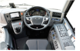
こちらは12m車の運転席回り。ミッションは従来通りのMTだ。

まずはパワーモードで発進。レブカウンター2500回転以上がレッドゾーン。アクセルの踏み込み量を60~70%程度で加速するとほぼ2000回転でシフトアップされていく。とてもスムーズに加速し、坂道発進時のクラッチミートと保持されていたブレーキ力解除のタイミングも絶妙。大きめな2モーターで制御されるクラッチは素早い作動性を披露してくれた。