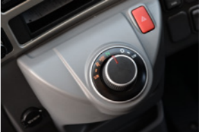
これが新しいAMT、プロシフトのセレクター。ダイヤル式のわかりやすい形状だ。

続いてエコモード。アクセルを軽く踏み込むと通常加速ではおおよそ1700回転あたりでシフトアップ。7速トップ80km/h時のエンジン回転数は1400回転弱。従来のモデルの元気が良かった出力特性は少しその影が薄れたが、どの回転域でもしたたかな粘り強さを披露してくれた。 ※バスマガジン85号より改稿転載