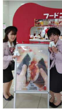
いつも美味しそうで一度 食べてみたかった！ ジャンボおにぎり1コ 380円