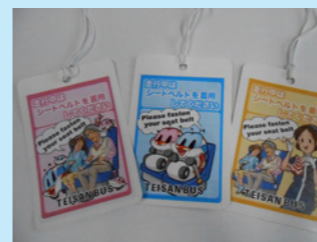
英語表記でインバウンド対策も

バス車内で配布しているオリジナル荷札をガイド制服リニューアルに伴い、この度新デザインに！デザインを新たに3つ作り、色はピンク・黄・青の3種類。このオリジナル荷札を使って、お客様へシートベルトの着用をお願いしていきます。