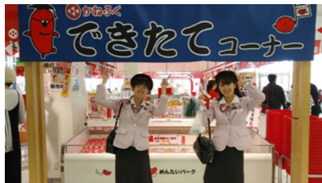
店のイチオシ！できたて明太子

▼店舗情報 めんたいパーク神戸三田 神戸市北区赤松台 1-7-1 TEL 078-986-1137 年中無休 営業時間：9:00～18:00 入場料：無料 (めんたいランドは有料)