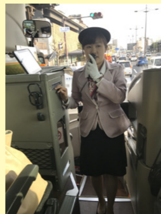
新入ガイド研修はタブレットを使っての教育