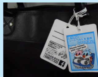
裏面にもバースナビが