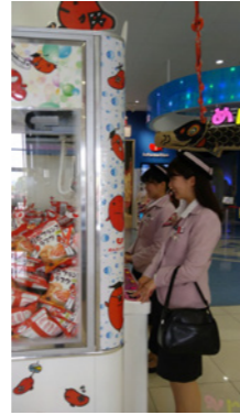
UFO キャッチャー 1回 100円 明太子お菓子 (非売品)

おいしいもの大好き♡のバスガイドがお届けす る、とっておきのグルメ情報。今回は、こんな お店に行ってみました♪