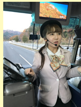
車内モニターで観光地の画像を投影

データベースをガイド一人一人のタブレットに連動させ、付箋(ブックマーク)やメモ機能により文章を書き加えることで、ガイドはお客様の要望やガイド自身が考えた自分なりの観光案内も可能に。更に、このタブレットでは、バス車内のテレビ画面を使ってその名所の写真・動画を映し出すことで、雨の日でも、立ち寄りたくない名所もお客様へ「見せる案内」で説明ができます。