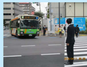
合言葉は『広げよう思いやりの輪』