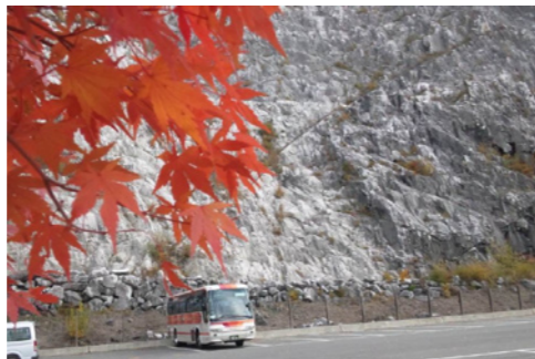
帝産バスは、秋が似合いますね（＾＾）／あぶくま洞の紅葉（福島）

春もいけど「帝産カラー」には、秋の紅葉が映えますねえ。というわけで、広報部員からの秋の便りを一挙公開！毎日忙しくパソコンと睨めっこしている事務所の皆さんもシーズンが忙しい理由を見てください。日本に四季がある限り「観光バス」は不滅です。