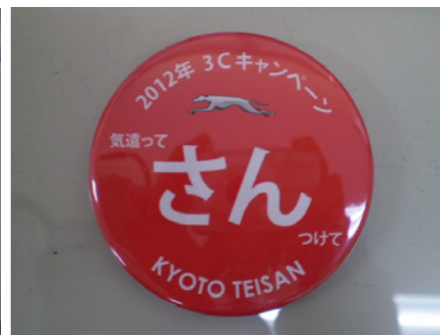
バッチを作った支店も?! 只今第2弾を計画中！（京都）