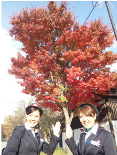
日光華厳の滝。食欲の秋にアイスクリームは欠かせません