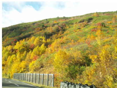
東北八幡平の紅葉（岩手）

春もいけど「帝産カラー」には、秋の紅葉が映えますねえ。というわけで、広報部員からの秋の便りを一挙公開！毎日忙しくパソコンと睨めっこしている事務所の皆さんもシーズンが忙しい理由を見てください。日本に四季がある限り「観光バス」は不滅です。