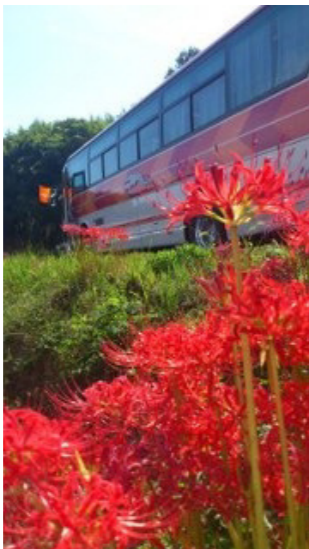
岡山に秋が訪れました