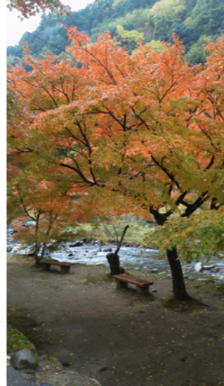
ちょっと早い香嵐渓（愛知）