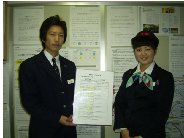
「点呼」の「台本」を作りました（東京）

毎年恒例となっている「〇〇運動」では各店の取り組み内容と合わせて、燃費走行や無事故キロ、営業成績などを支店間で競争しています。1位の支店には、特別予算枠の使用権が与えられ、支店の設備を充実させることができます。今年の1位はどこ支店でしょうか？各店の取り組みを紹介します。