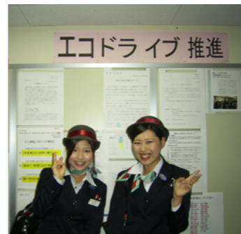
掲示物は外せません。各店いろいろ工夫しています（左：東京 右：名古屋）

毎年恒例となっている「〇〇運動」では各店の取り組み内容と合わせて、燃費走行や無事故キロ、営業成績などを支店間で競争しています。1位の支店には、特別予算枠の使用権が与えられ、支店の設備を充実させることができます。今年の1位はどこ支店でしょうか？各店の取り組みを紹介します。