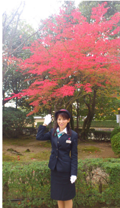
聖徳太子も見た紅葉かな？ 法隆寺（奈良）