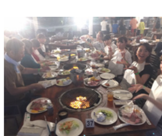
夕陽を眺めながらビーチBBQ