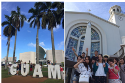
観光ガイドの説明を聞きながらスペイン広場を見学