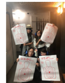
フリータイムで実弾射撃体験