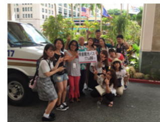
専用バスで半日観光