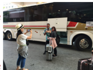
寒い日本から常夏のグアムへ

5年目を迎えた当社のガイド研修制度。4年生ガイドによるグアム研修を実施しました。12月の寒い日本から常夏の楽園グアムへ！現地では、ガイド付きの大型バスでグアム観光。夕食は、目の前に広がる壮大な海を眺めながらのセットBBQにディナーショーと異国文化をたっぷり吸収してきました。 来年は、北海道研修、そして再来年には世界の観光地ハワイ研修を予定しています。