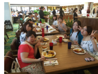
みんなでホテル朝食