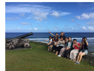
ラッセストーン展望台