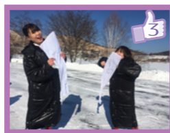
白樺湖泊まりのお仕事! 気温はマイナス°Cで寒い! タオルを濡らして振り回してみたら、凍っちゃいました! 雪山あるあるでした(・ω・)/ 皆さん、お風邪をひきませんように(・o・)/ 京都支店ガイド広報担当

お仕事の中で出逢った、大切な言葉と風景... 日々の感動が私たちのパワーになるんです! 私が出逢ったひと言・ひとこま