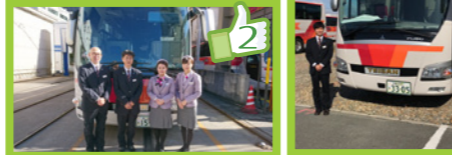
今日から運転士制服が新しくなりました! 昨年リニューアルしたガイド制服に合わせたデザインで、Yシャツの腕には犬のロゴマーク刺繍、ネクタイは矢羽根のオレンジカラー、ボタンには TEI SAN BUS の印字を施しています。これから宜しくお願い致します。 総務部広報担当