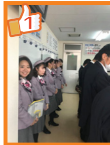
久しぶりの修学旅行の台数口! 張りきって行きます♪ ガイド広報担当