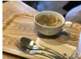
コンソメスープ。もやしの食感がとても良かったです。