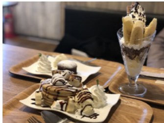
パンケーキ・パフェ・スイーツは見た目も可愛い上にすごく美味しかったです。

スープの数がすごく多くて選ぶのが大変でした。その中から厳選したのがコンソメスープです。