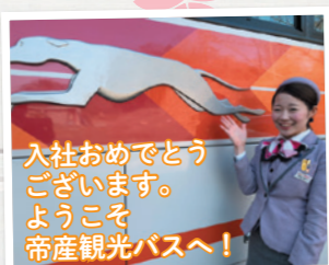
入社おめでとう 渡邊莉湖 (東京支店)

私たちの仲間が増えてとても嬉しいですが、私たちの仕事は日々勉強の毎日です。色々なことを学んで、体験して自分自身成長できるステキな仕事です。一緒に頑張っていきたいと思います！