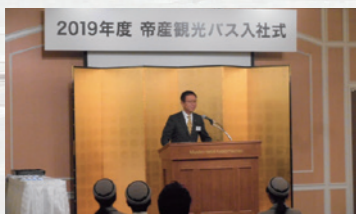
2019年度 帝産観光バス入社式