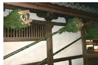
お松明は4~5m、60kgもある大きなものですが、12日に使う特大の籠松明は6m、80kgとい う特大サイズのものです

この本行以外にも様々な儀式 を行っていて、とても奥が深い 行事です。この行事が終わると、 ようやく奈良にも春が訪れると 言われています! 二月堂の本尊・十一面観音に 日頃の罪穢れを懺悔し、国の平 穩や五穀豊穡を祈る法要です。 旧暦の2月に行われていたの で、2月に修する法会という意 味をこめて修二会とも呼ばれて います。 この法要の本行が3月1日 14日まで、2週間に渡って行わ れる、12日の深夜には境内にある 若狭井という井戸から本尊に お供えするお香水を汲み取るこ とから「お水取り」、また練行 衆が二月堂に上堂する際に、足 元を照らす大松明で先導される ことに由来し「お松明」とも 呼ばれています。今年で何と 1268回目をむかえました。 本行中の2週間、夜7時から 大きなお松明を灯し、練行衆と 呼ばれる僧侶たちが二月堂の舞 台を走り回ります。もともとは 練行衆が歩く際の道あかりとし て行われていました。使用され る松明は長さが約7mで、修行 中に使われる松明は10種類以上 にも及び、火が灯った光景は迫 力満点です。