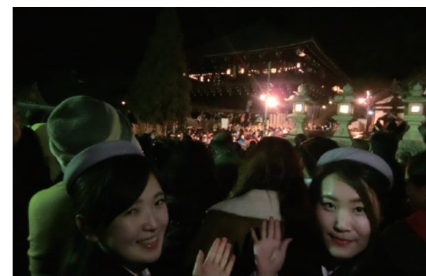
人垣に遮られてしまいましたが、根性で自撮り