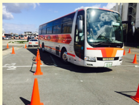
研修の前に運転士によるドライブコンテストを実施

社員同士の交流をより深められ、チームワークを高めることができた研修となりました。