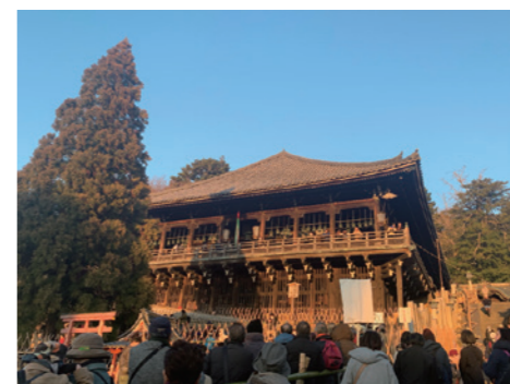
二月堂には早い時刻から多くの人が訪れていました