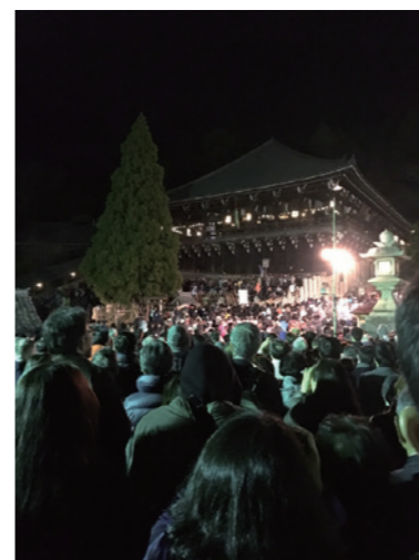
陽が沈み、お松明を灯した僧侶が登場します