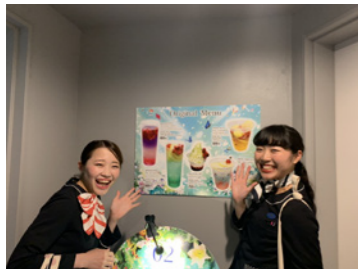
メニューも豊富です