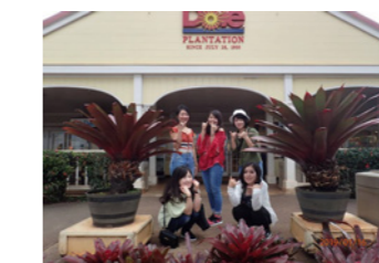
6年目は世界のハワイ

2014年度からスタートしたガイド研修旅行。今年度の行き先が決定しました。この研修旅行は、全店の同期同士の交流を深め、また海外研修では国際感覚を身につけ、日本の文化や品格を改めて感じて欲しいという思いが込められています。そして、来る2020東京オリンピック・パラリンピックでは、日本を訪れる世界各国の人々を日本が誇るおもてなし文化で迎え入れられます。 コースは、2年目：野辺山1泊富士急ハイランド研修、3年目：TDR研修・USJ研修、4年目：グアム研修、5年目：冬の北海道研修、6年目：世界の観光地ハワイ研修です。