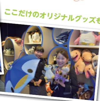
ここだけのオリジナルグッズも