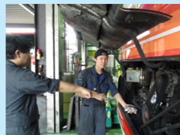
整備の基礎を習得