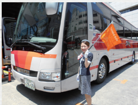
バスガイドの仕事は楽しいよ!