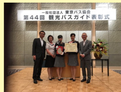
東京バス協会3年表彰受賞(左)と5年表彰(右)

6月は、東京支店と名古屋支店、京都支店で表彰が行われ、褒賞状と記念徽章の授与が行われました。朝早い出庫や夜遅い入庫、急な仕事など今日まで様々な業務をやり遂げ、バスガイドの仕事の続けてきた努力の賜物です。