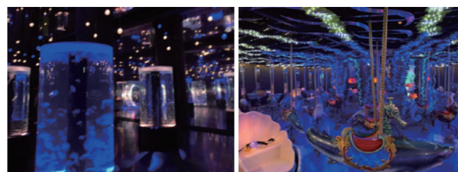
写真映え間違いなしな ジェリーフィッシュランブルとメリーゴーランド!!