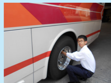
運行前点検はしっかりと