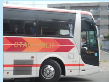
基本に忠実に「後退時は窓を開け」