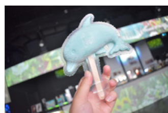
不思議！？ 可愛いイルカの溶けないアイス！