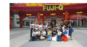
2年目研修の富士急ハイランド