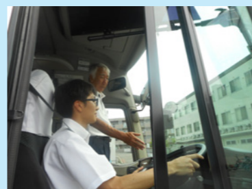
育成バスで運転技術を伝授