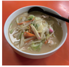
ちゃんぽん定食はチャーハンがついて780円