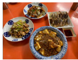
もちろん他にもいろいろ!