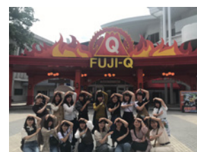
2年目研修の富士急ハイランド