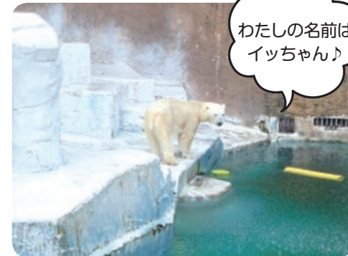
ゴーゴとイッチちゃん。写真はイッチちゃん。あの豚まんまで有名な「551 蓬萊」さんから寄贈されたそうです!!