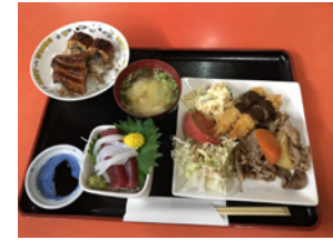
昌園定食(日替り)はこのボリュームで780円