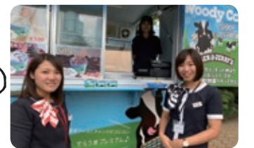
ベン&ジェリーズ アメリカ生まれのアイスです。チョコやフルーツ等のチャックがゴロゴロ! 噛んで食べる楽しいアイスです。動物園ではこだけでしか食べれないよ!! キッチンカー「COWCAR」で発売中!