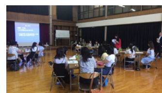
グループミーティングで発表