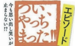
今更に出し笑いが止まらない!!