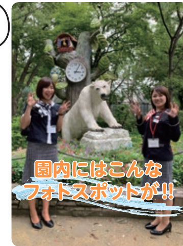
園内にはこんなフォトスポットが!!