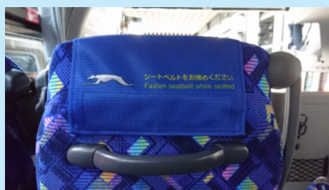
シートベルト着用の呼び掛けと、当社のエンブレムが入ったヘッドカバー

全てはお客様の安全を確保し、快適なご旅行の提供が目的で、今後もシートベルト着用の喚起を引き続き行っていきます。