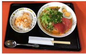
夏はオススメ担々冷麺定食