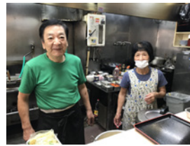
ご主人と奥さまお世話になってます

おいしいもの大好き♡のバスガイドがお届けする、とっておきのグルメ情報。今回は、こんなお店に行ってみましたっ! 大阪支店の車庫の真裏にある中華料理店「昌園」! 値段もお手頃価格。ランチもボリューム満点! 大阪支店で待機の際は、ぜひ「昌園」で!!!