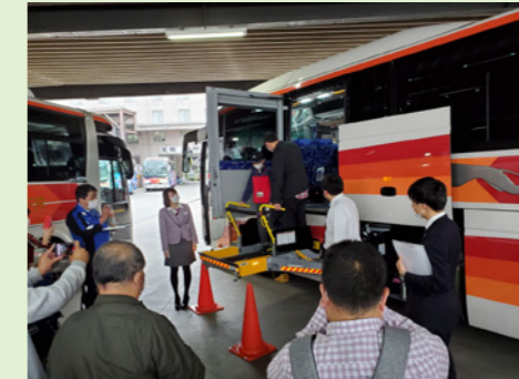
車椅子リフト車の昇降体験