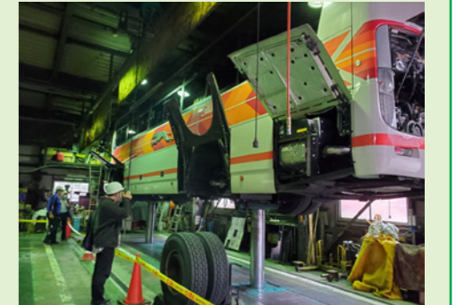
整備工場内でバスの見学