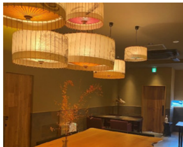
お店の雰囲気もおしゃれで居心地が良かったです。