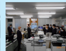
大阪支店インスペクション