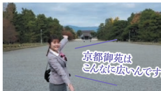
京都御苑はこんなに広いです!!