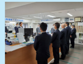
東京支店インスペクション