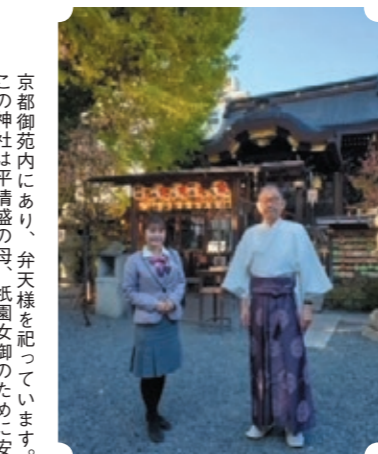
宮司さんとの一枚。色々お話をお聞かせいただきました。