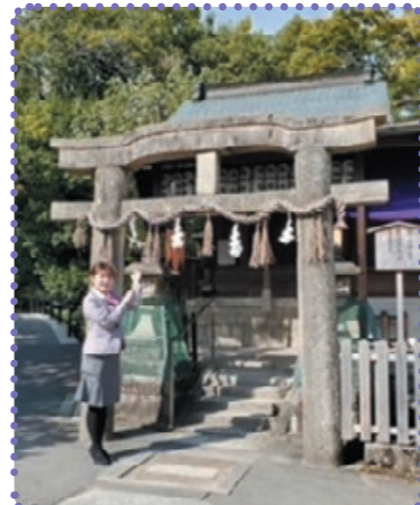
この鳥居は「唐破風鳥居」と呼ばれ、あまり見られない珍しい形の鳥居です。北野天満宮の石造鳥居・蚕ノ社の三柱鳥居と合わせて「京都三珍鳥居」とされています。

京都御苑内にあり、弁天様を祀っています。この神社は平清盛の母、祇園女御のために安芸の嚴島神社を勧請したものです。後に祇園女御が祀られました。