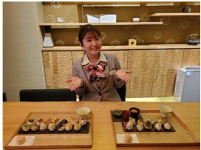
カラフルで写真映えすると人気の手鞠鮎♥ 舞妓さんが化粧を崩さず一口サイズで食べられるように作られました。健康にも配慮した鮮やかなお鮎と日本茶でほっと一息つきませんか？

おいしいもの大好き♡のバスガイドがお届けする、とっておきのグルメ情報。今回は、こんなお店に行ってみました♪