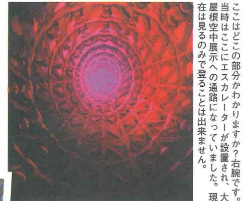
ここはどこかの部分かわかりますか？右腕です。当時はここにエスカレーターが設置され、大屋根空中展示への通路になっていました。現在では見るのみで登ることは出来ません。