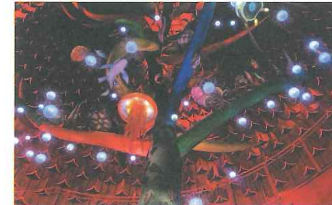
胎内は生命の樹が上へ上へと伸びています。下から原生類、上に行くにつれて哺乳類と生命の進化の過程を表しています。33種類、183体の生物模型が展示されており、樹の幹を這ったり、枝にぶらさがったりしています。