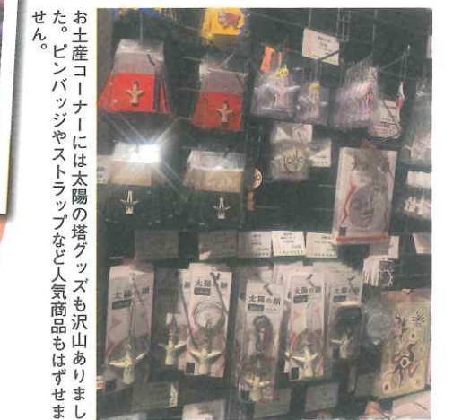
お土産コーナーには太陽の塔グッズも沢山あります。ピンバッジやストラップなど人気商品もぜひチェックしてください。