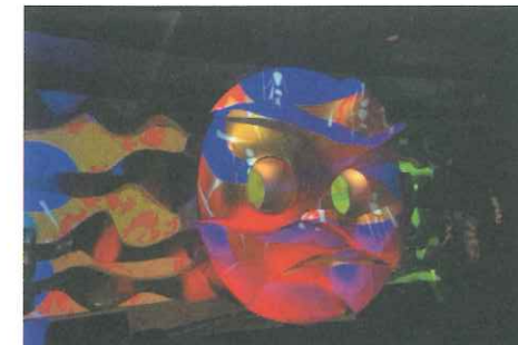
当時は第4の顔、地底の太陽がいましたが、行方がわからなくなりこちらは復元されたものです。

開館時間 10:00~17:00 (最終受付 16:30) ※休館日は万博記念公園に準ずる。 入園料・入館料要、現在入館は予約優先 (公式サイトより予約可能)