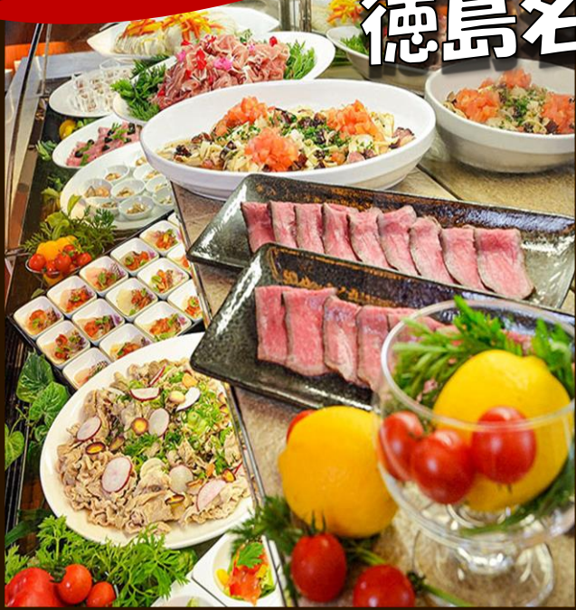
ホテルグランドニッコー淡路 ※写真はイメージです