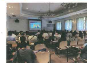
大阪支店 SDGs 研修の様子

先日、神戸・大阪それぞれの支店で慰安旅行が開催されました。今回の旅行は神戸支店が日帰りで須磨方面、大阪支店は一泊二日で山代温泉へ。今回はSDGsについて学ぶ機会を設け、それぞれ資源のリサイクル、食やエネルギーの地産地消等について体験を交えながら学習致しました。 コロナ禍を経て久しぶりの慰安旅行のため皆で楽しみつつも、SDGsに興味関心を深めることができ大変有意義な旅行となりました。今回学んだ事をお客様へのご案内や日々の業務に活かす事ができるよう努めて参ります。