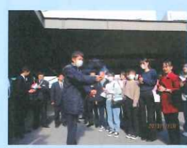
発煙筒の着火講習・体験

12月20日、東京支店にて重大事故想定訓練が行われました。高速道路路上での追突事故を想定し、車両からの乗客誘導及び負傷者の安全処置の確認の他、緊急通報や関係機関への連絡・報告の流れや対応方法を乗務員と事務職員で連携しながら再確認致しました。事故が起きないよう日々細心の注意を払うことが最重要ですが、今後も定期的に訓練を行い、万が一の事態に備え日頃から緊急対策への意識を高めてまいります。