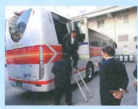
バス右後方の非常用扉から脱出する様子