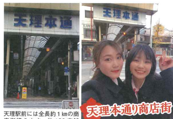
天理本通り商店街

天理駅前には全長約 1 km の商店街続きます。約 180 店舗が並び、飲食店、衣料品店、さらに信仰の街ということもあり神具店も多くあります。なんだか懐かしさを感じる雰囲気を楽しみつつ歩きたくなるような風景です。