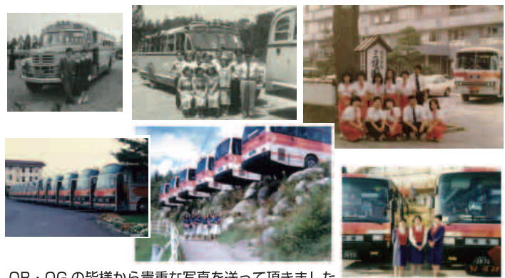
OB・OGの皆様から貴重な写真を送って頂きました

来年1月、皆様のおかげで創立70周年を迎えます。今後は70周年記念企画などを展開していく予定です。これからも引き続き帝産バスをよろしくお願ひ致します。