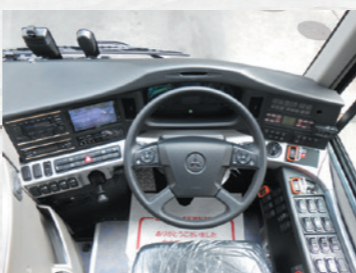
運転席は最新の機能が充実