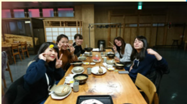
北海道の冬のグルメを堪能