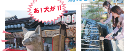
これはもうガイドなのでバッチリ！