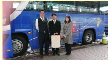
札幌観光バス様にお世話になりました

4年目を迎えた当社のガイド研修制度。野辺山富士急ハイランド研修、TDL・USJ研修、ハワイ研修に続き2017年度最後は、5年生による北海道研修を実施。交流のある札幌観光バス様へ旅行のコーディネートとバス手配を依頼し、真冬の北海道のお薦めコースを堪能してきました。今回札幌市内をご案内いただいたのは、入社4年目のガイドさん。参加者は他社ガイドの仕事を見る事ができ、すごくいい勉強と刺激になりました。お楽しみの食事は、北海道の名物であるジンギスカンに海鮮料理、札幌発祥のスーパカレーに蟹のフルコースと美味しい物を沢山食べてきました。来年はいよいよハワイ研修です。