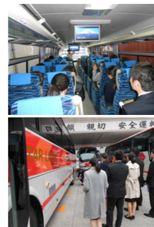
乗車体験(上)、運行前点検(下)

新卒求人活動の新たな取り組みとして、2月に学生向けインターンシップを実施しました。東京、名古屋、京都各支店にて3日間で合計100名を超える学生さんにご参加頂き、観光バスの仕事体験や当社の魅力について紹介しました。当日は、運行前点検の見学から実際に参加者自らアルコールチェックも体験。その他、点呼の見学に観光バス乗車体験など、当社の安全の取組みの紹介も踏まえ、観光バス運行の流れについて身を持って体験頂きました。当社では、3月以降も随時、事務職・運転士・ガイド・整備士各職種の新卒求人活動を行ってまいります。