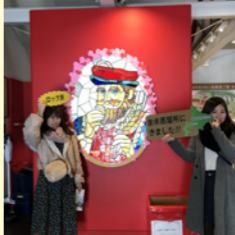
余市ウイスキー工場