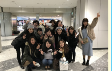
あっという間の3日間でした