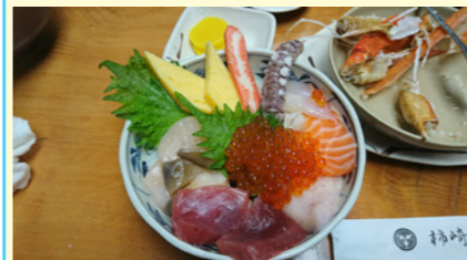
北海道と言えば海の幸！ 美味しかった(蠣崎商店・余市町)