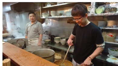
お店の雰囲気もアットホーム

今回は、名古屋市北区にある鯨乃屋さんにお邪魔しました！なんと！！名古屋カレーうどんの元祖のお店なのです。昔ながらの暖簾もまたいい感じ♡お店の中に入り、カウンター席合わせて14席の空いている席へ。私達は看板メニューのカレーうどんを食べました♪とろみのあるカレーと少し太めのうどん、ほっぺたが落ちこちるほど美味しかったです！しかも、店長さんも店員さんもすごく優しく笑顔がステキで疲れも癒されました！