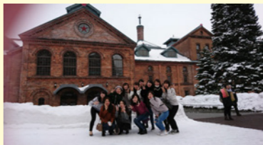
北海道はデッカイどう(^^)