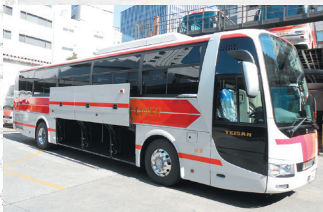
3スパンの広いトランクでたくさんの荷物の積込が可能に