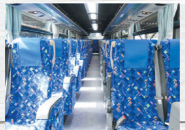
3点式シートベルトを全正席に採用