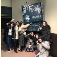
白い恋人工場見学