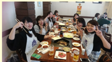
ジンギスカン食べ放題