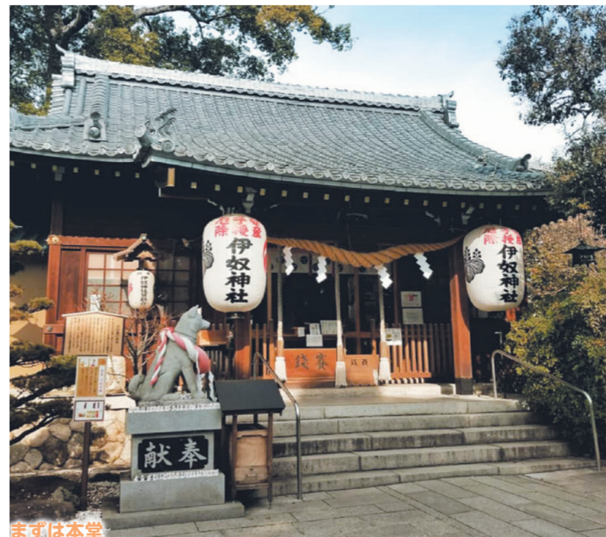
まずは本堂 境内にはたくさんの犬がいるということで、我が社の犬のマーク(グレイハウンド)とのご縁を感じ、行ってみました！