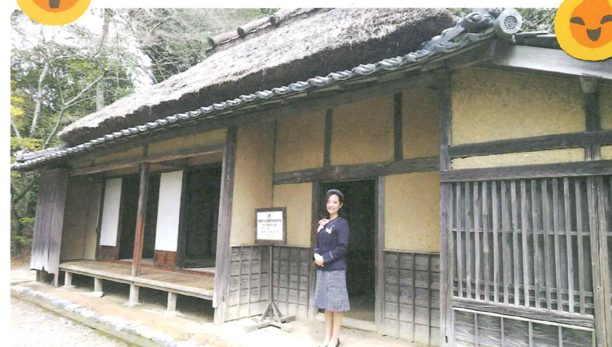
昔はもう少し南にあった生家。後に移築・保存され、昭和47年に県指定民俗文化財に指定されました