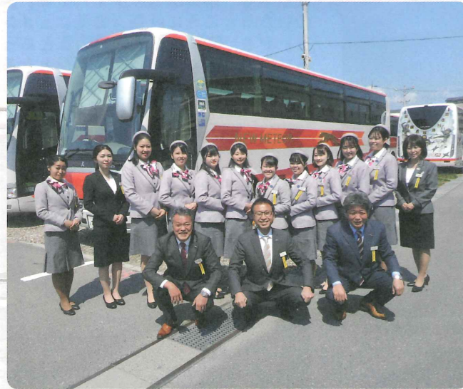
京都・名古屋支店