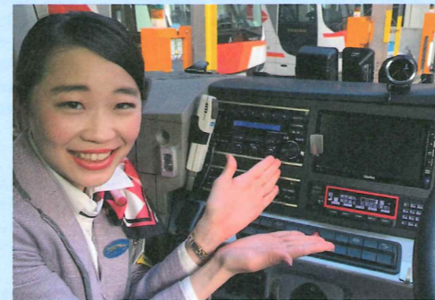
新たなデジタルタコグラフとドライブレコーダーは、当社保有の全車両に搭載しております

双方の機器が一体型となったことで保守性も向上し、事務所側ではより確実な運行管理が行えるようになりました。ドライバーの高い技術と最新鋭の運行支援機器で、安全運行をお届けします。