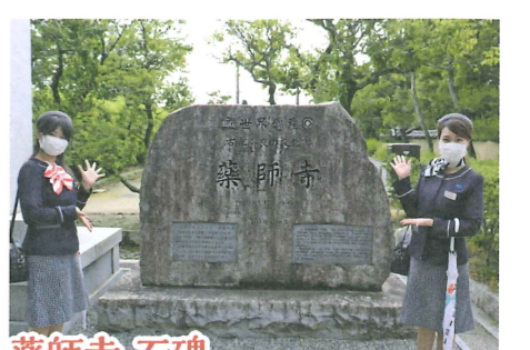
薬師寺 石碑 南大門側の石碑。世界遺産登録をしめすものだそうです。