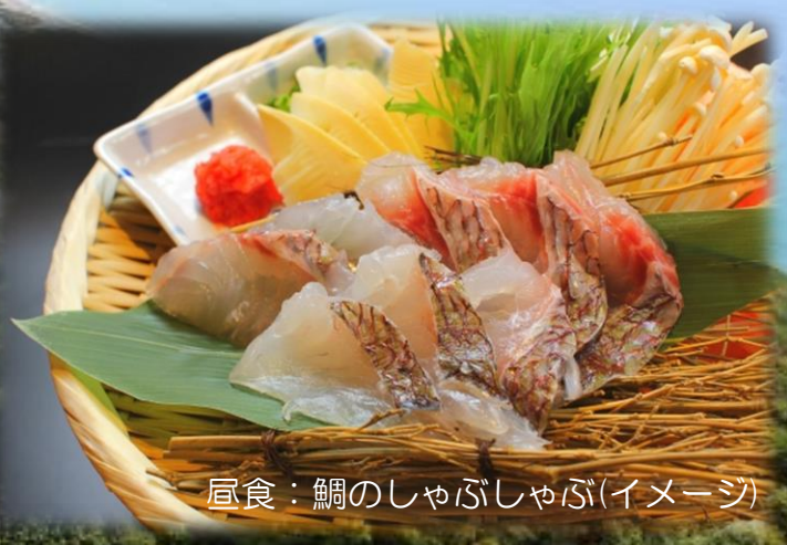
昼食：鯛のしゃぶしゃぶ(イメージ)