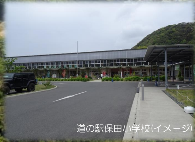
道の駅保田小学校(イメージ)