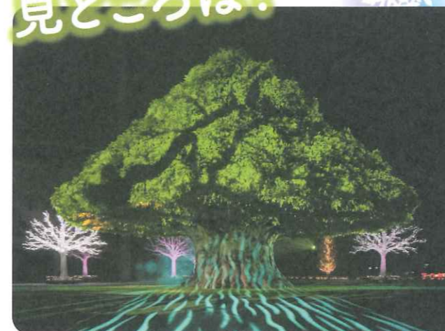
光と遊ぶ大樹！【上演時間：約8分30秒】