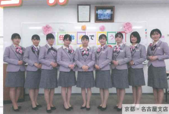
京都・名古屋支店

まずは、先輩ガイドとの台数口からのスタートです。これから素敵なバスガイドを目指す、デビューしたての帝産レディをどうぞよろしくお願いいたします。