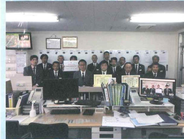
神戸支店表彰写真