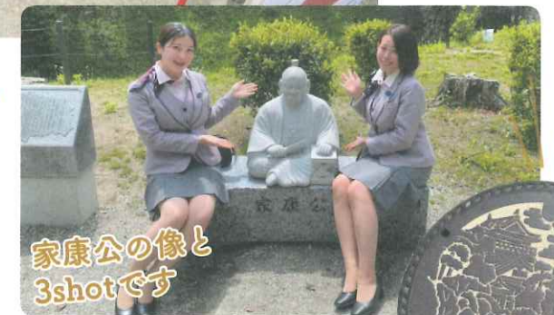
家康公の像と3shotです