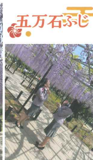
岡崎公園の南側には1300平方メートルの藤棚があり毎年4月中旬～5月中旬にかけて美しい紫色の「藤の花」を楽しむことができます。藤は岡崎市の花であり、2022年には愛知県の天然記念物にも指定されました!! 夜には藤棚のライトアップも行われ、日中とはまた違う美しく幻想的な藤を堪能できます。