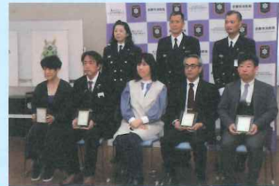
西田運転士（前左から二番目）