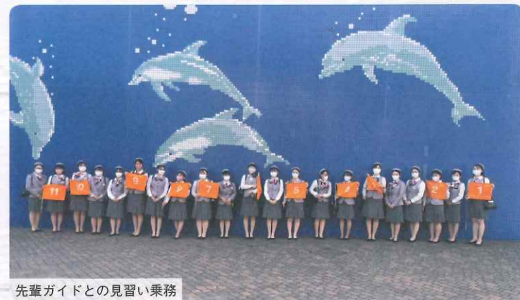
先輩ガイドとの見習い乗務