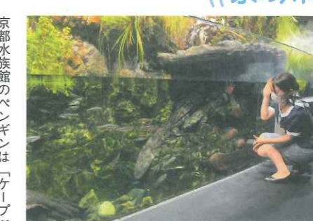
京都の川を泳いでいる魚たちに会える! 注目の“オオサンショウウオ”はお土産としても人気!!