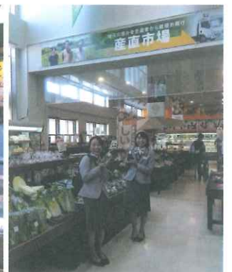
ナナファーム須磨