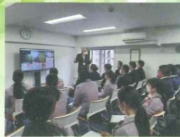
危険予知トレーニング

日頃は違う業務をこなしている運転士・ガイド・事務職が一体となって課題に取り組み、様々な視点から物事を考える良い機会となりました。