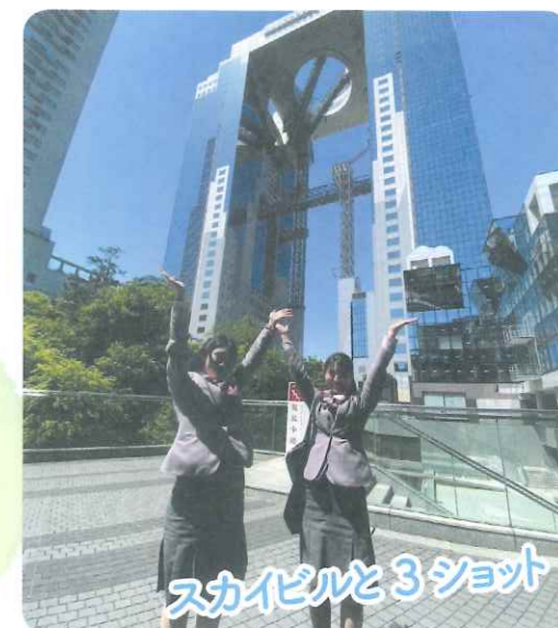
スカイビルと3ショット

ブリッジが架かり、2棟のビルが手をつなぐように繋がっているため災害時の避難路の機能や地震の揺れにも強いなど、安全性にも優れているのです。