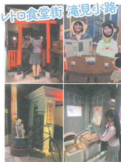
ビルの地下1階には、昭和の大阪を再現したレトロな世界が広がっています! まるでタイムスリップしたような気分が味わえます。

丹波の黒豆を石臼で挽いて、きなこを作りました! 本造り笑来美餅とみたらし団子を頂きました!! 〒531-0076 大阪府大阪市北区大淀中1丁目1番90-B100 (TEL) 06-6440-5928 (営業時間) 11:00 ~ 20:00