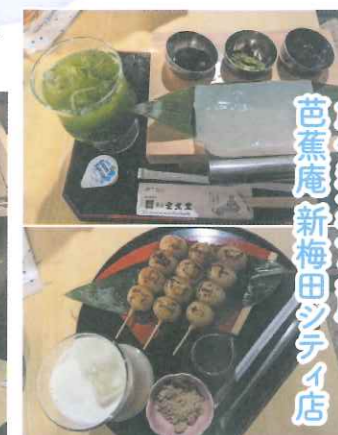
創作和菓子工房 芭蕉庵 新梅田ソテイ店

空中庭園展望台です。360度パノラマビューが楽しめます! 大阪のみならず、六甲山系や晴れた日には淡路島も見ることが出来ます。全10色からハート型の南京錠を選び名前を印字出来ます。想いを込めて屋上にロックしてはいかがでしょう。中には人気アイドルの名前も!? (現在はネット予約のみ)