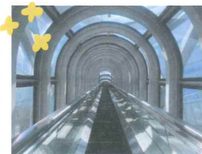
シースルーエスカレーター! ドキドキ、ワクワクさせてくれます。スリル満点です!!

スカイビルを紹介する写真は、ここからの景色が多いようです。ビルの工事はリフトアップ工法により、地上で組み上げた空中庭園を7時間かけて上空まで吊り上げました。