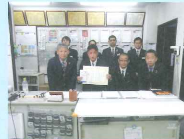
奈良支店 西口運転士表彰

今後もこのような機会を通じて、当社のみならず観光業界やバス業界を目指す学生が増えるようなきっかけづくりを進めて参ります。